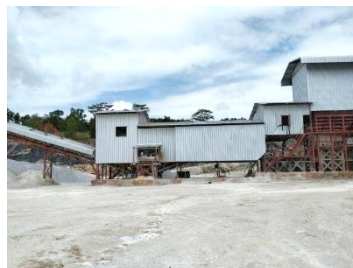
โรงแต่งแร่ของโครงการ