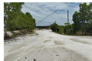
ทางเข้า-ออกพื้นที่โครงการ