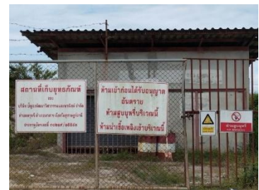
อาคารเก็บวัตถุระเบิด