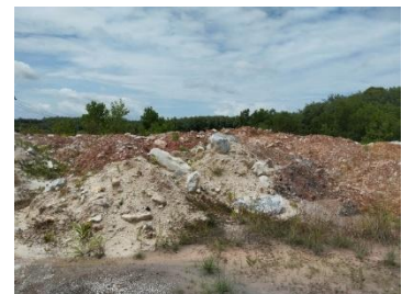
กองเปลือกหิน/ดิน