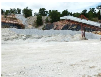
ลานเก็บกองแร่