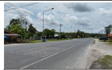
ทางหลวงหมายเลข 4009