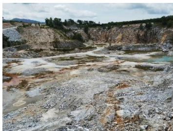
พื้นที่หน้าเหมือง